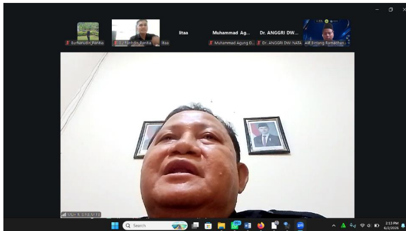
Gambar 4. Sambutan dan Pembukaan oleh Rektor

Dalam sambutannya, Rektor menekankan beberapa poin krusial yang menjadi landasan pelaksanaan kegiatan ini, antara lain: