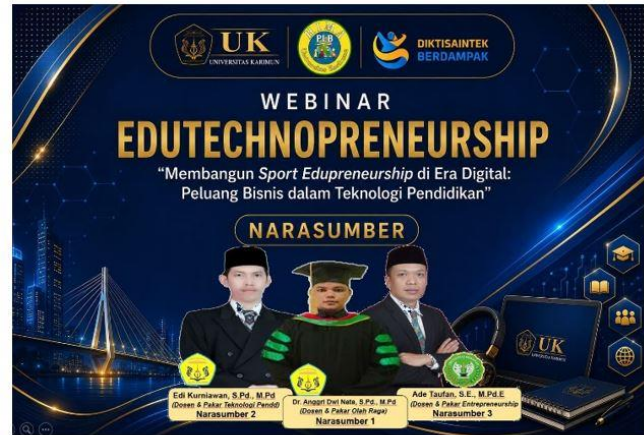
Gambar 2 flyer Webinar

Spanduk dan Banner ini disebarakan ke khalayak ramai, group whatsapp, media sosial lainnya.