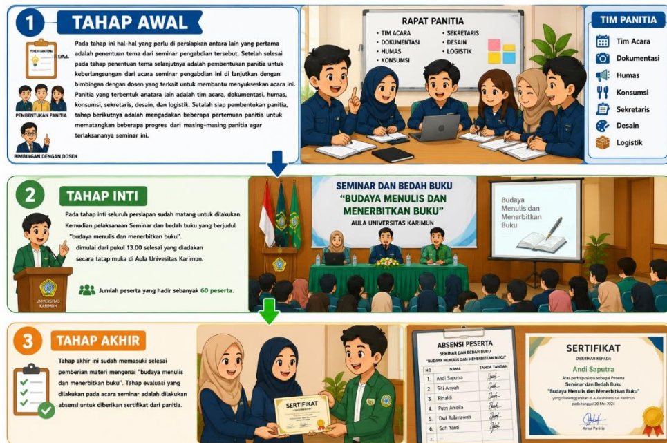
Gambar 1 Tahapan Webinar