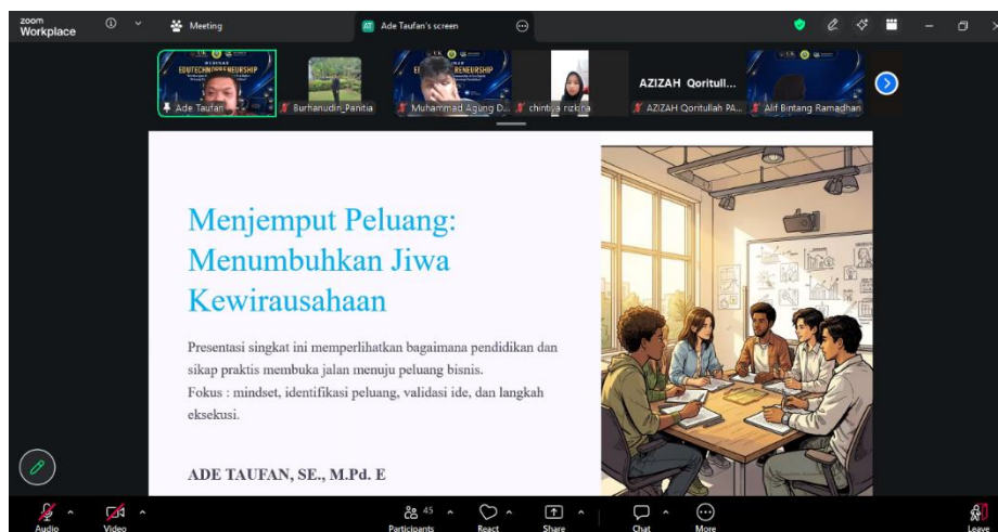
Gambar 5. Narasumber Ade Taufan, M.Pd.E

Sesi pemaparan materi dilanjutkan oleh narasumber, yaitu Bapak Ade Taufan, SE., M.Pd. E , yang mengusung topik " Menjemput Peluang: Menumbuhkan Jiwa Kewirausahaan ". Sesi ini berfokus pada fondasi utama dalam membangun mentalitas seorang wirausahawan kependidikan di era digital.